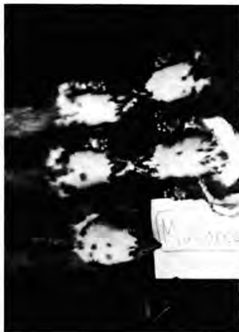
Fig. 2. Disseny de la taca pectoral a diversos exemplars de M. martes de Mallorca.

S'ha observat que existeix una gran variabilitat en la coloració de la taca de la gargamella dels exemplars mallorquins: tres exemplars presenten la taca de color taronja viu, cinc de color taronja pàl·lid, un de color blanc ataronjat i els altres dos blanc-crema/grog pàl·lid. Pel que fa a la forma de la taca, HUTTERER & GERAETS (1978) presenten un dibuix mostrant el disseny de la taca dels dos exemplars mallorquins que han estudiat. Aquests autors indiquen que les taques pectorals dels Marts mallorquins són petites i estretes. Les observacions realitzades no recol-